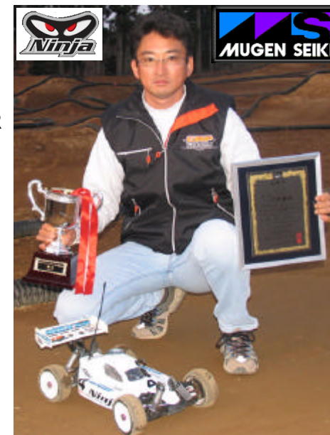
NINJAエンジンセット付 MBX 5Rキット