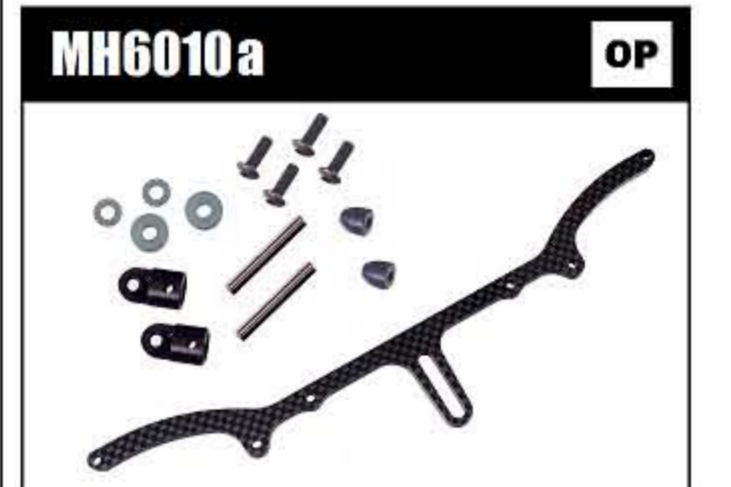
MH6010a リヤボディマウントセット ¥6,800